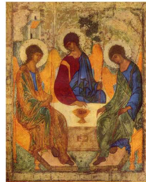
Comisión Diocesana por la Comunión